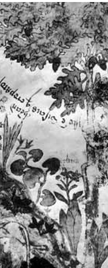
La récolte des simples, d'après un formulaire italien, XV e siècle.

sur la protection des inventions issues des biotechnologies et pèsent sur la convention biodiversité. Le texte final de la CDB comporte des références plus ou moins explicites aux droits de propriété intellectuelle (cf. article 16.5 sur le transfert de technologie).